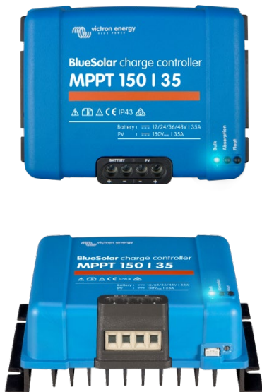
Controlador de carga solar MPPT 150/35